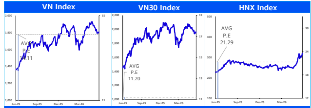
Các chỉ số chính trên thị trường chứng khoán Việt Nam (tỷ đồng)

Chiến lược: Giai đoạn này, nhà đầu tư có thể tập trung lựa chọn các cổ phiếu cấu trúc giá tích lũy đi ngang và kết quả kinh doanh tăng trưởng tốt thay vì chỉ tập trung nhìn vào biến động của chỉ số VN-Index (tăng điểm thời gian qua do tác động lớn từ nhóm VIC group). Theo quan sát của chúng tôi, nhiều cổ phiếu nhóm ngành như bất động sản, ngân hàng, vật liệu xây dựng hay chứng khoán... có cấu trúc giá tích lũy, kết quả kinh doanh cải thiện và phù hợp để nhà đầu tư giải ngân đơn kết quả kinh doanh Q2 và Q3/2026. Nhà đầu tư hạn chế sử dụng margin khi xu hướng chưa được xác định rõ ràng trong giai đoạn này.