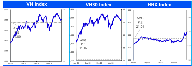
Các chỉ số chính trên thị trường chứng khoán Việt Nam (tỷ đồng)

Chiến lược: Giai đoạn này, nhà đầu tư có thể tập trung lựa chọn các cổ phiếu cấu trúc giá tích lũy đi ngang và kết quả kinh doanh tăng trưởng tốt thay vì chỉ tập trung nhìn vào biến động của chỉ số VN-Index (tăng điểm thời gian qua do tác động lớn từ nhóm VIC group). Theo quan sát của chúng tôi, nhiều cổ phiếu nhóm ngành như bất động sản, ngân hàng, vật liệu xây dựng hay chứng khoán... có cấu trúc giá tích lũy, kết quả kinh doanh cải thiện và phù hợp để nhà đầu tư giải ngân đòn kết quả kinh doanh Q2 và Q3/2026. Nhà đầu tư hạn chế sử dụng margin khi xu hướng chưa được xác định rõ ràng trong giai đoạn này.