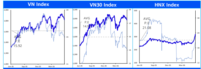
Các chỉ số chính trên thị trường chứng khoán Việt Nam (tỷ đồng)

Chiến lược: Giai đoạn này, nhà đầu tư có thể tập trung lựa chọn các cổ phiếu cấu trúc giá tích lũy đi ngang và kết quả kinh doanh tăng trưởng tốt thay vì chỉ tập trung nhìn vào biến động của chỉ số VN-Index (tăng điểm thời gian qua do tác động lớn từ nhóm VIC group). Theo quan sát của chúng tôi, nhiều cổ phiếu nhóm ngành như bất động sản, ngân hàng, vật liệu xây dựng hay chứng khoán... có cấu trúc giá tích lũy, kết quả kinh doanh cải thiện và phù hợp để nhà đầu tư giải ngân đón kết quả kinh doanh Q2 và Q3/2026. Nhà đầu tư hạn chế sử dụng margin khi xu hướng chưa được xác định rõ ràng trong giai đoạn này.