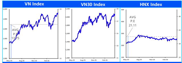
Các chỉ số chính trên thị trường chứng khoán Việt Nam (tỷ đồng)

Chiến lược: Giai đoạn này, nhà đầu tư có thể tập trung lựa chọn các cổ phiếu cấu trúc giá tích lũy đi ngang và kết quả kinh doanh tăng trưởng tốt thay vì chỉ tập trung nhìn vào biến động của chỉ số VN-Index (tăng điểm thời gian qua do tác động lớn từ nhóm VIC group). Theo quan sát của chúng tôi, nhiều cổ phiếu nhóm ngành như bất động sản, ngân hàng, vật liệu xây dựng hay chứng khoán... có cấu trúc giá tích lũy, kết quả kinh doanh cải thiện và phù hợp để nhà đầu tư giải ngân đón kết quả kinh doanh Q2 và Q3/2026.