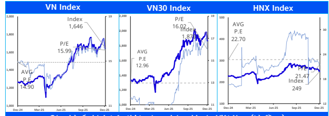
Các chỉ số chính trên thị trường chứng khoán Việt Nam (tỷ đồng)