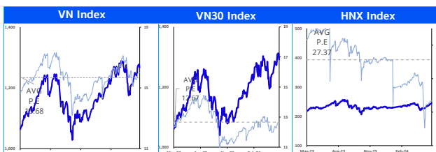
Các chỉ số chính trên thị trường chứng khoán Việt Nam

Góc nhìn kỹ thuật: VN-Index giảm hơn 10 điểm dưới áp lực chốt lời tại vùng đỉnh cũ ngắn hạn với thanh khoản gia tăng. Chúng tôi cho rằng thị trường có thể tiếp tục có những phiên điều chỉnh trong thời gian tới. Vùng hỗ trợ gần nhất của chỉ số VN-Index là 1,240-1,250 tương ứng với EMA 50 và EMA 20. Nếu VN-Index có thể giữ được vùng hỗ trợ này và tích lũy thành công thì chỉ số có thể tiếp tục xu hướng tăng giá. Trong trường hợp xấu hơn, vùng hỗ trợ tiếp theo là 1,190 điểm, tương ứng với EMA200 của chỉ số. Chiến lược: Nhà đầu tư tạm ngưng việc mua mới khi thị trường đã tăng nóng liên tục. Nếu tích lũy thành công và vẫn giữ được xu hướng tăng, nhà đầu tư có thể mua dần vào quanh vùng EMA50.