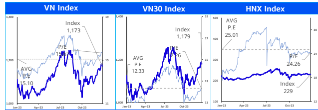
Các chỉ số chính trên thị trường chứng khoán Việt Nam