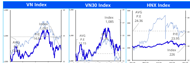
Các chỉ số chính trên thị trường chứng khoán Việt Nam

Góc nhìn kỹ thuật: Thị trường tiếp tục giảm hầu hết trong phiên, với giá đóng cửa ở mức thấp nhất cho thấy lực mua lên hầu như không có. Hiện tại thị trường vẫn giao dịch trong biên độ 1,080-1,130 tính từ đầu tháng 11. Kỳ vọng thị trường sẽ có sự phục hồi khi VNINDEX đã quay lại vùng hỗ trợ dưới tương đương 1,080. Như vậy xu hướng chính của VNINDEX vẫn là đi ngang trong biên độ. Trong kịch bản tiêu cực, nếu VNINDEX thủng vùng 1080, khả năng cao thị trường sẽ về lại vùng 1,040 điểm.